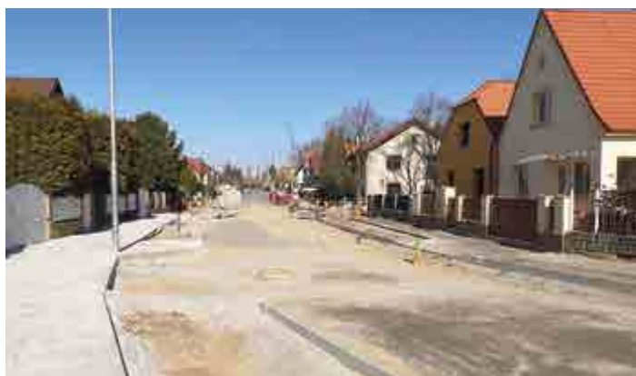
Rekonstrukce ulice Mírová