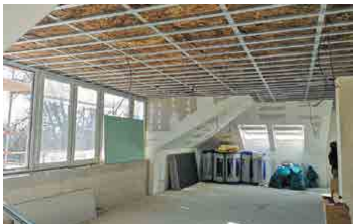
Rekonstrukce MŠ Dráček