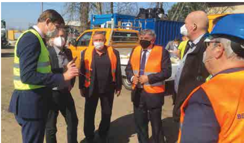
Z návštěvy 1. náměstkyně hejtmanky Středočeského kraje pana Mgr. Martina Kupky na investičních akcích rekonstrukcí ulic ČSA a Mírová