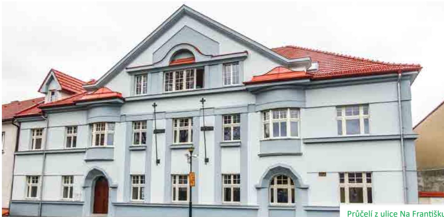
Průčelí z ulice Na Františku