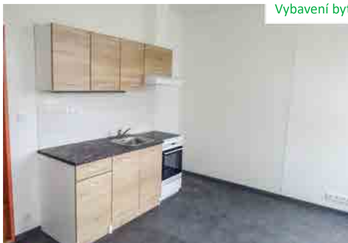
Vybavení bytových jednotek