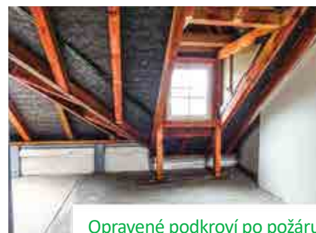
Opravené podkroví po požáru