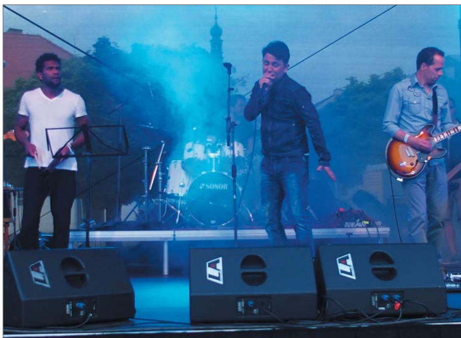
Lysá žije 2016