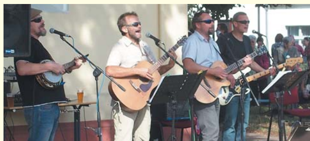
Jednou z účinkujících kapel bude i Trampstejk

Druhý zářijový víkend se bude v Byšičkách ve velkém slavit. Obec má 300 let. Oslavy spolu s byšičkými hasiči a za pomoci města připravuje osadní výbor. V programu se vedle místních a regionálních souborů a hudebních uskupení představí řada známých tváří. Nebude chybět program pro děti, slavnostní fanfáry trubačů nebo například historický průvod s hrabětem Špokem a jeho družinou. Podrobnosti o programu přineseme v dalších vydáních Listů. Vstupné na oslavy bude zdarma.