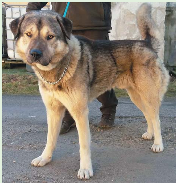
Kříženec velkého vzrůstu – pes, stáří cca 1,5 roku, přátelský s vyrovnanou a klidnou povahou... volný k adopci