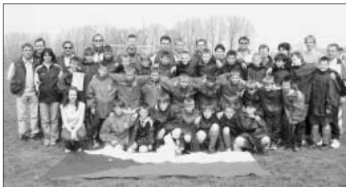
Účastníci zájezdu fotbalových nadějí v polské Leszyci ve dnech 30. 4. a 1. 5. 2005